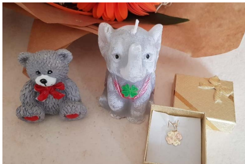
19.11.2022 Byly uspořádány vánoční dílničky