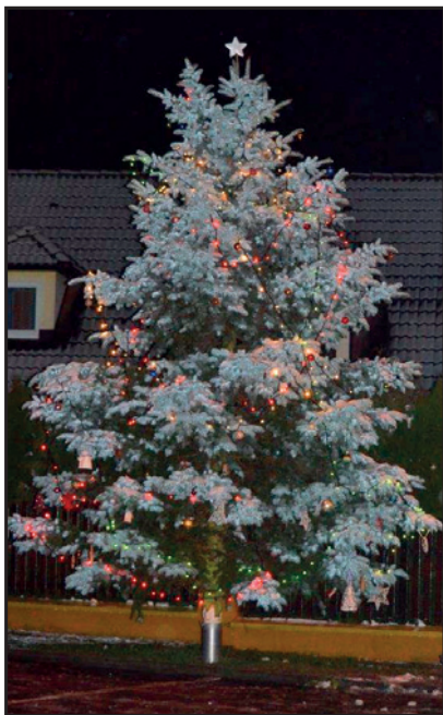
Děkujeme manželům Švecovým za vánoční strom, který věnovali obci.

Na závěr děkuji všem zastupitelům, spolkům a občanům, kteří se aktivně zapojují do dění v obci. Budu se těšit na setkání s Vámi na některé z kulturních akcí, které obec v příštím roce zorganizuje. Hned tou první je Masopust, který se koná v sobotu 30. ledna 2016.